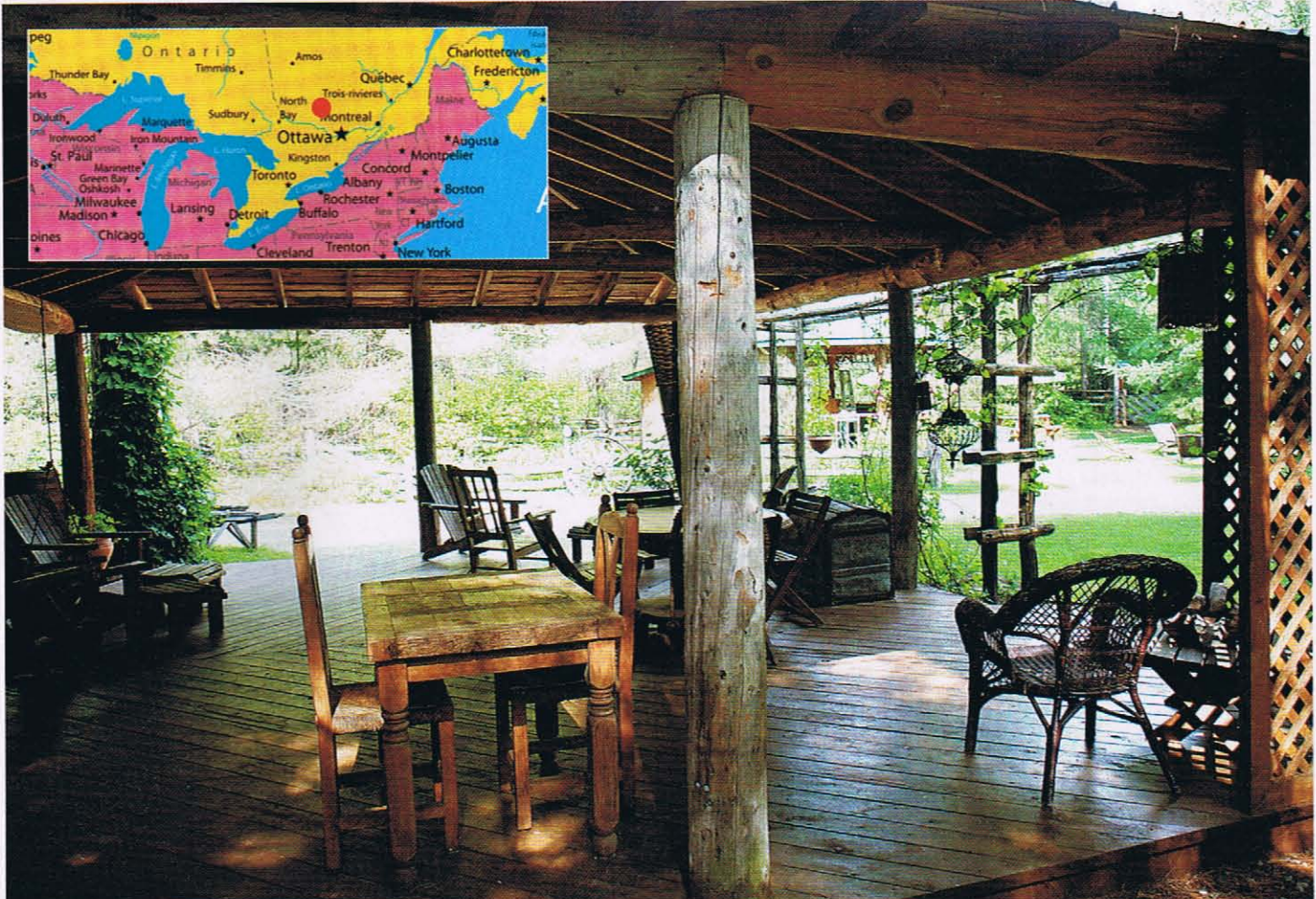
On vient de loin, à pied, à cheval, à vélo... pour apprécier le calme et le confort.